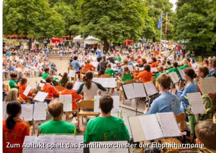
Zum Auftakt spielt das Familienorchester der Elbphilharmonie