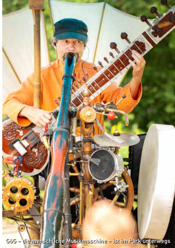
GÖG – die menschliche Musikmaschine – ist im Park unterwegs