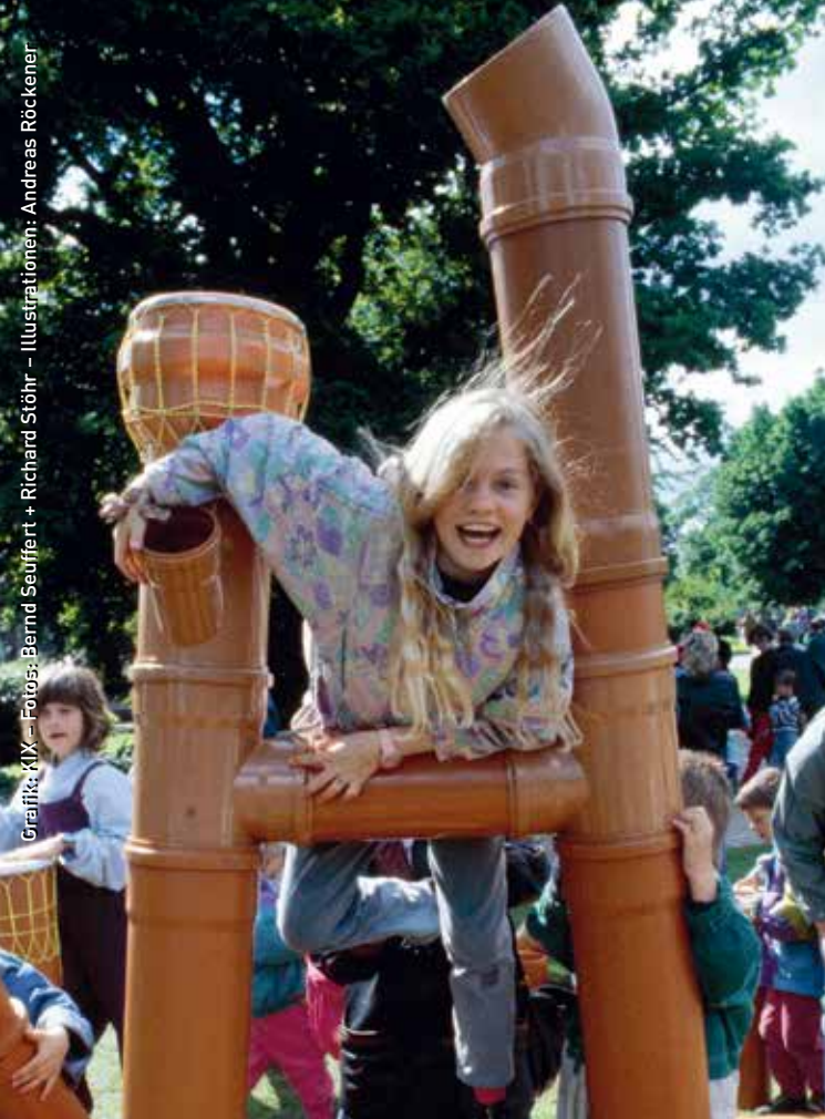
Grafik: MIX – Illustrationen: Andreas Röckner