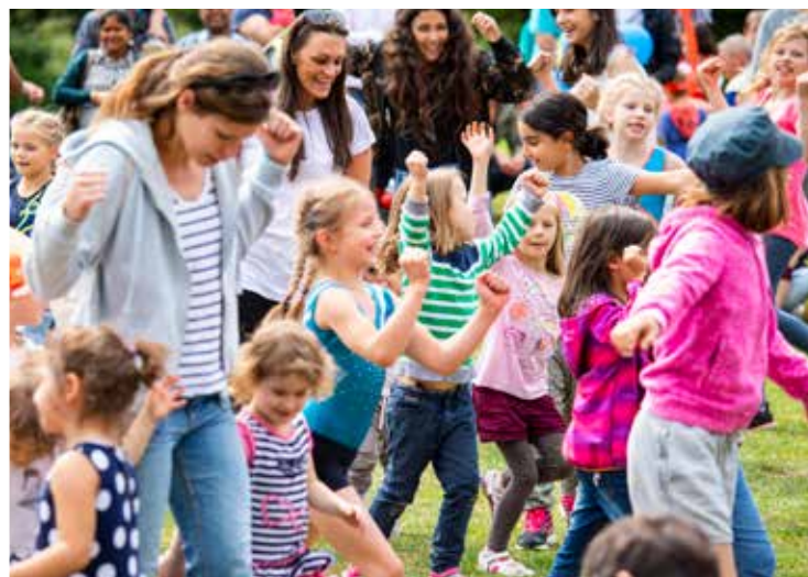
Kindertanzen mit dem Verband für Turnen u. Freizeit und sportspaß e.V.

Der Eintritt und alle Angebote sind frei!