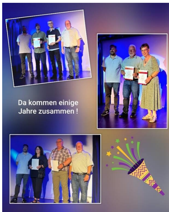
Da kommen einige Jahre zusammen !

Geehrt wurden für ihre jahrelange Treue zum Musikkorps – auch schon im Juni 2025 bei der Jubiläumsfeier zum 115-jährigen Bestehen des Orchesters: